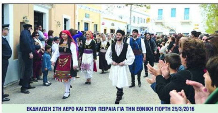
ΕΚΔΗΛΩΣΗ ΣΤΗ ΛΕΡΟ ΚΑΙ ΣΤΟΝ ΠΕΙΡΑΙΑ ΓΙΑ ΤΗΝ ΕΘΝΙΚΗ ΓΙΟΡΤΗ 25/3/2016